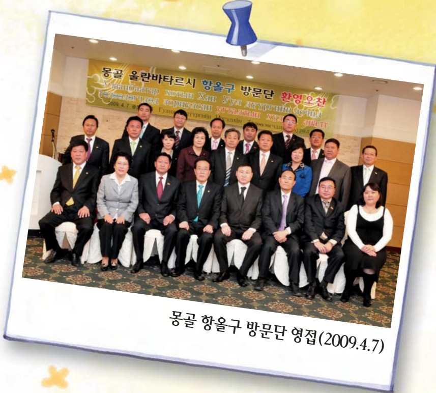
몽골 향을구 방문단 영접(2009.4.7)