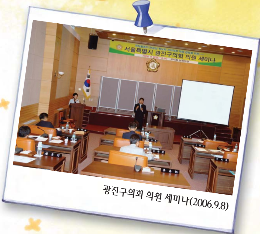
광진구의회 의원 세미나(2006.9.8)