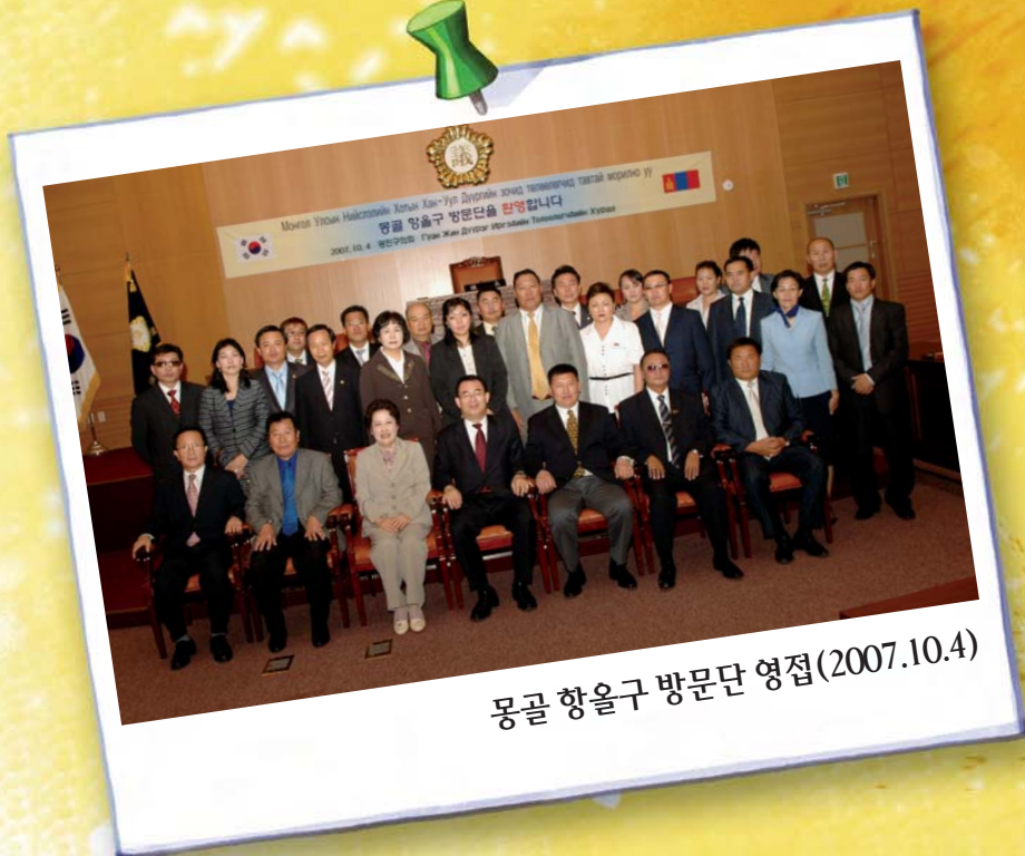
몽골 항을구 방문단 영접(2007.10.4)