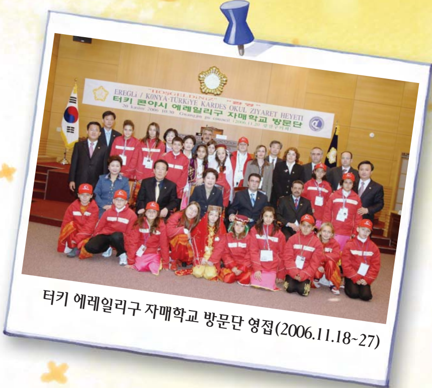
터키 에레일리구 자매학교 방문단 영접(2006.11.18~27)