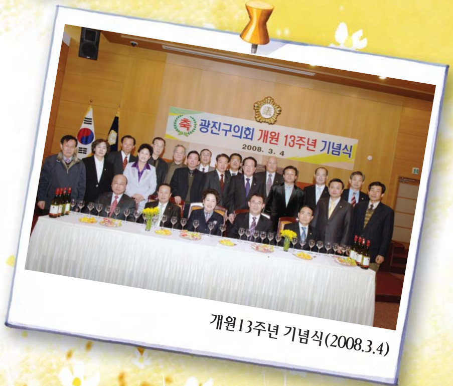
개원 13주년 기념식(2008.3.4)