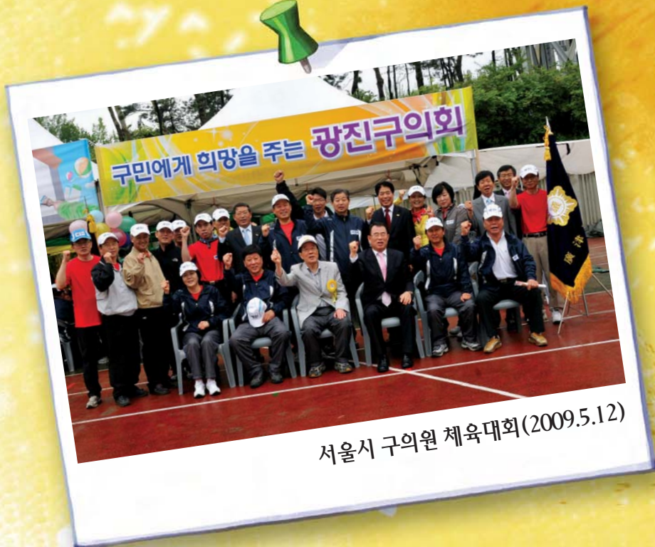
서울시 구의원 체육대회(2009.5.12)