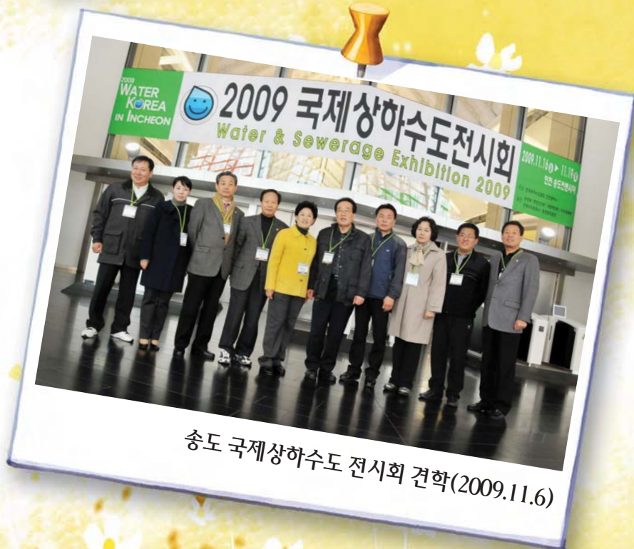
송도 국제상하수도 전시회 견학(2009.11.6)