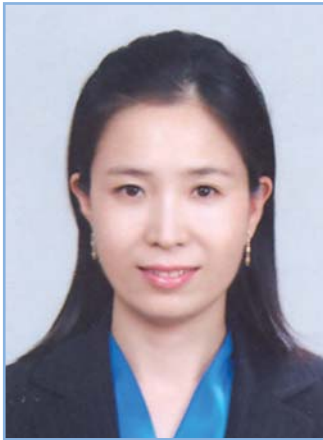
이수진 의원 비례대표(한나라당)