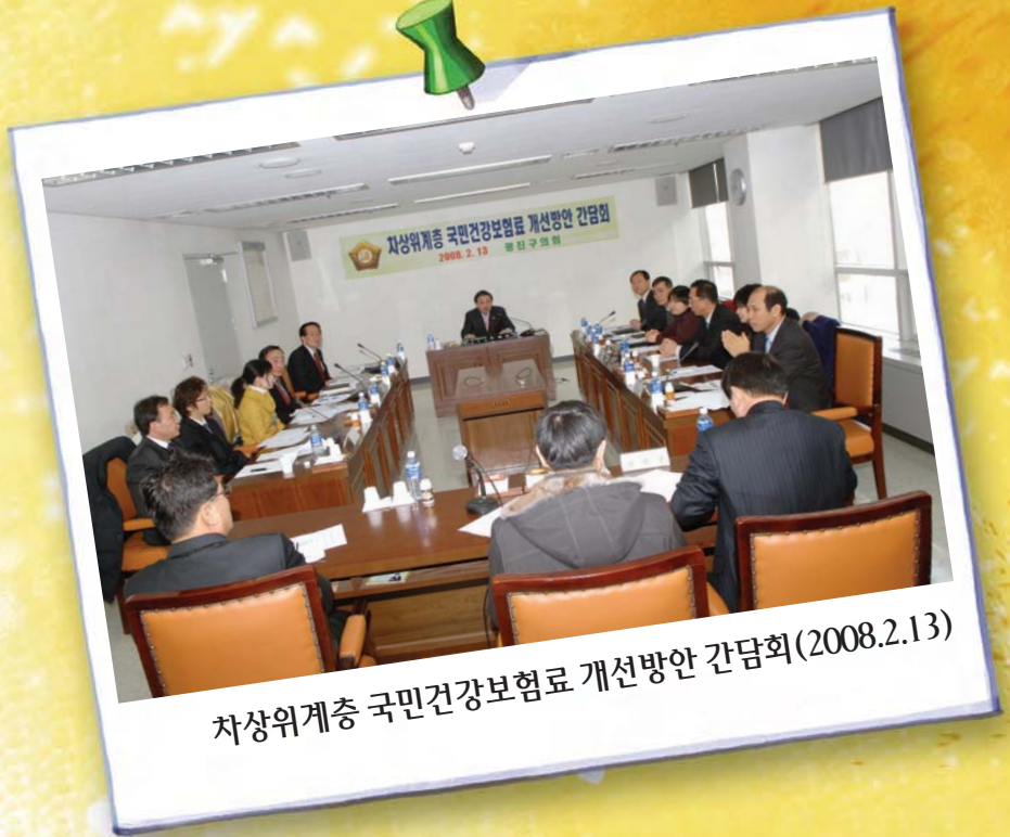
차상위계층 국민건강보험료 개선방안 간담회(2008.2.13)