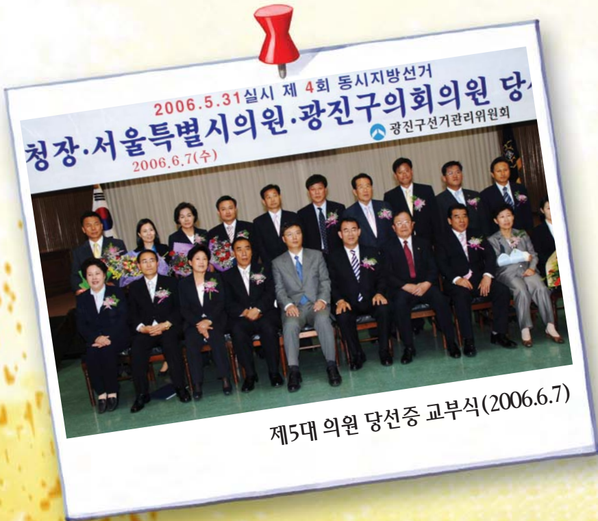
2006.5.31 실시 제 4회 동시지방선거 청장·서울특별시의원·광진구의회의원 당 2006.6.7(수) 광진구선거관리위원회