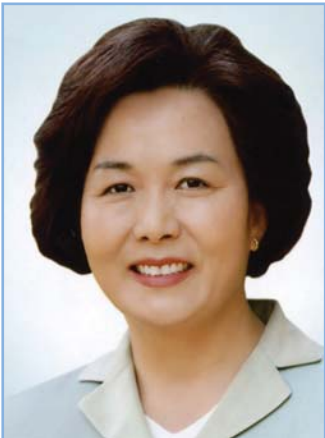
박삼례 의원 비례대표(민주당)

• 생년월일 : 1943. 4. 29 • 전화번호 (사) : 462-9955 • 전화번호 (현) : 011-228-7551