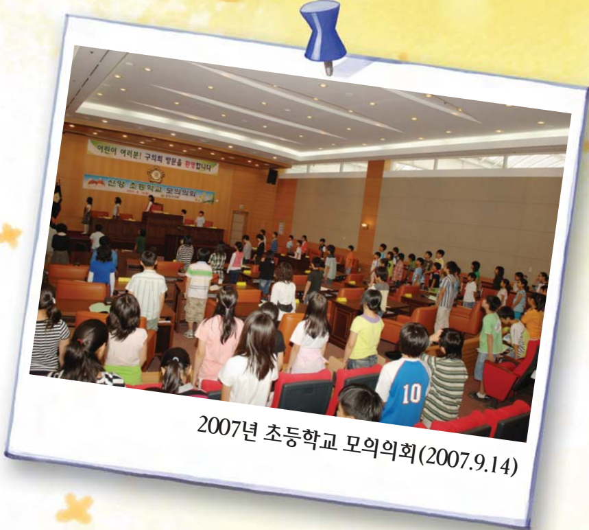
2007년 초등학교 모의의회(2007.9.14)