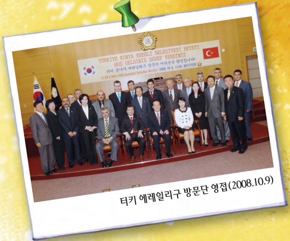
터키 에레일리구 방문단 영접(2008.10.9)