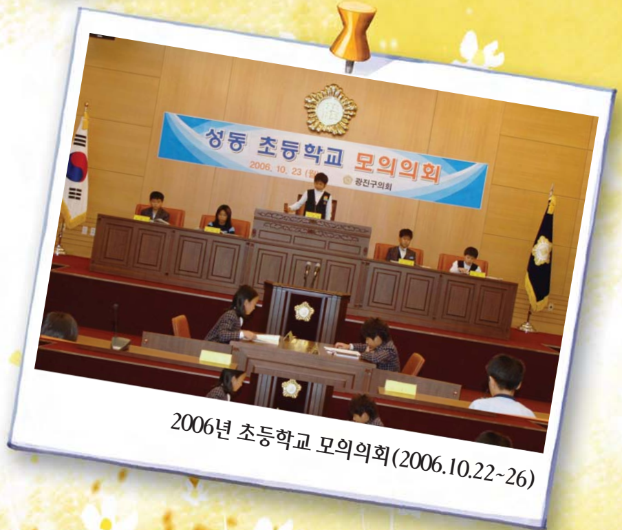
2006년 초등학교 모의의회(2006.10.22~26)