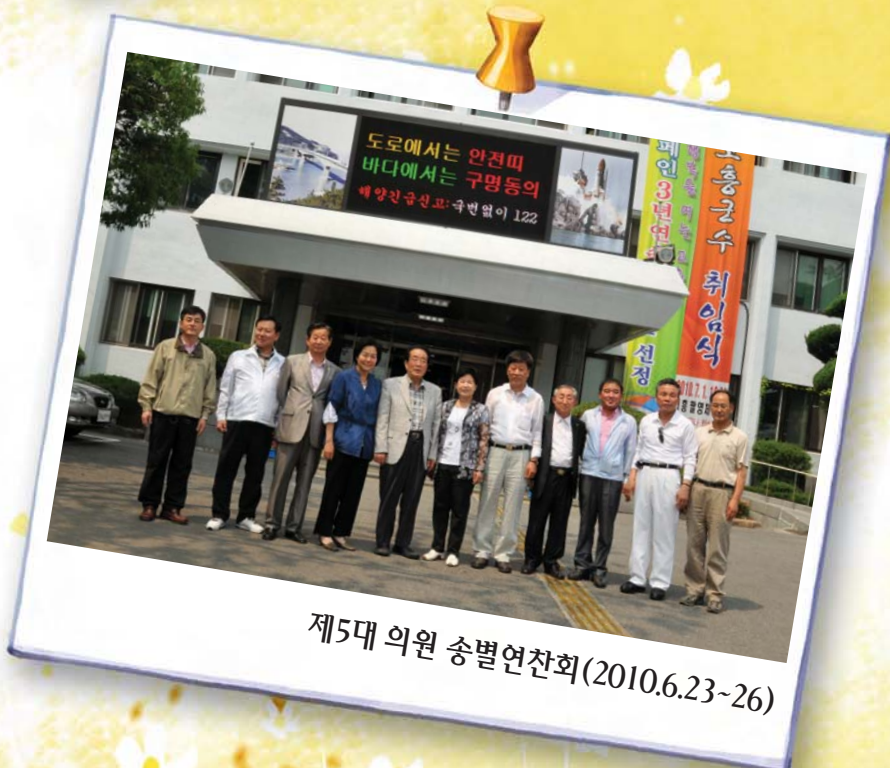
제5대 의원 송별연찬회(2010.6.23~26)