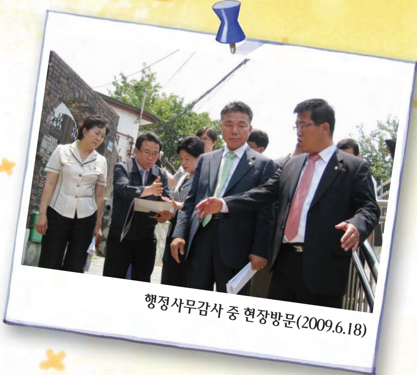
행정사무감사 중 현장방문(2009.6.18)