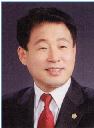
조동기 의원 비례대표(한나라당)