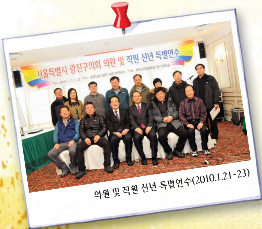
의원 및 직원 신년 특별연수(2010.1.21~23)