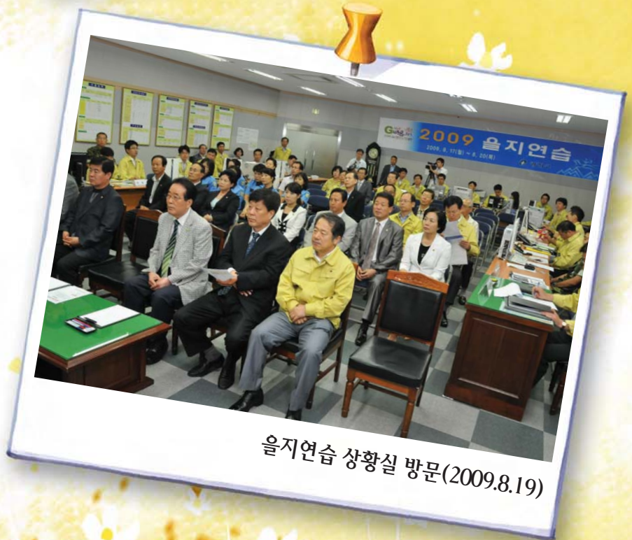
을지연습 상황실 방문(2009.8.19)