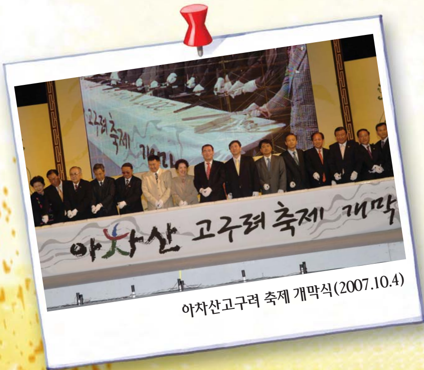
아차산고구려 축제 개막식(2007.10.4)