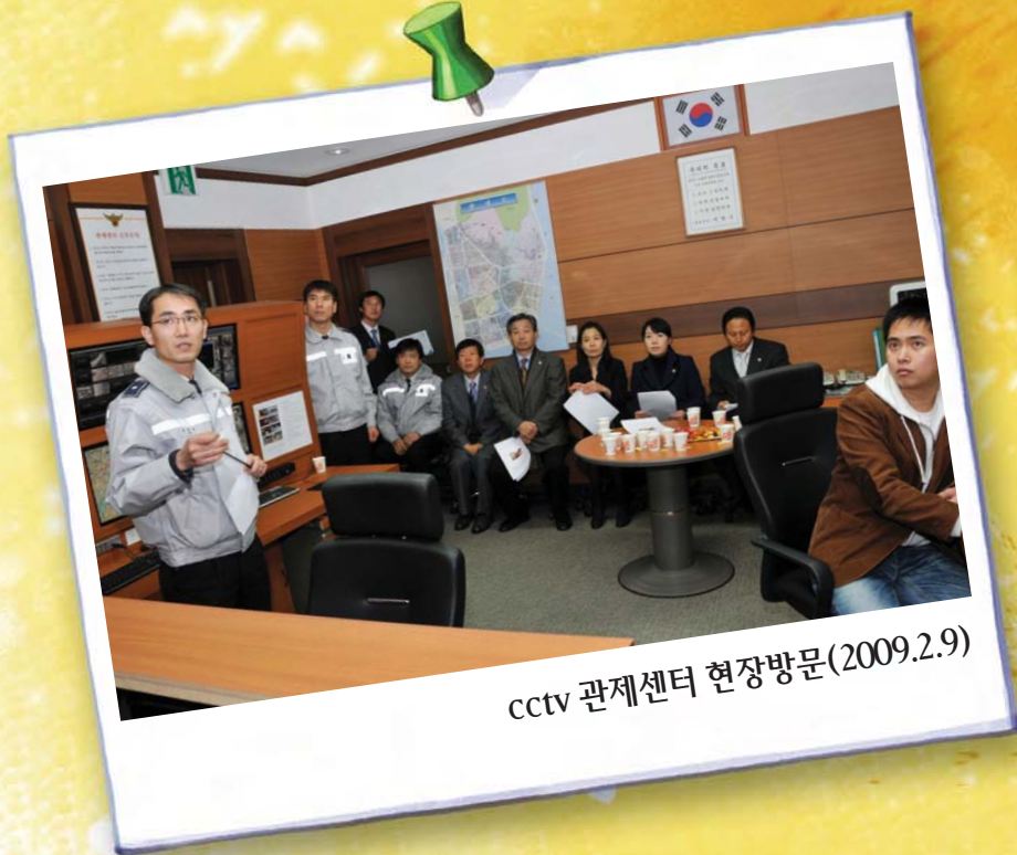
cctv 관제센터 현장방문(2009.2.9)