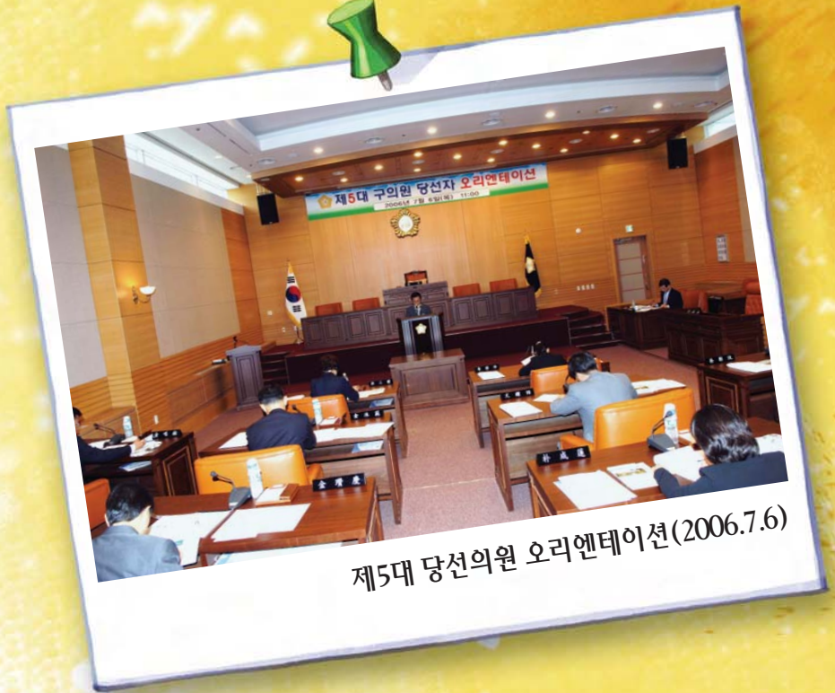
제5대 당선의원 오리엔테이션(2006.7.6)