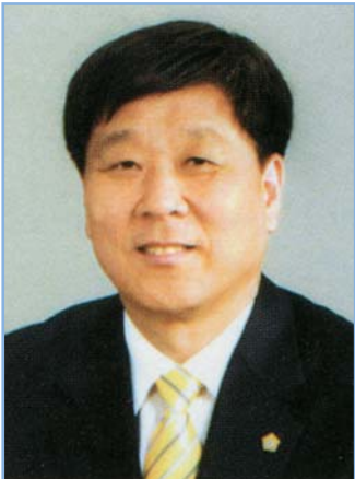
박근수 의원 광진구 가 선거구 (중곡1·2·3·4동)