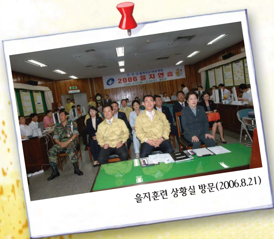
을지훈련 상황실 방문(2006.8.21)