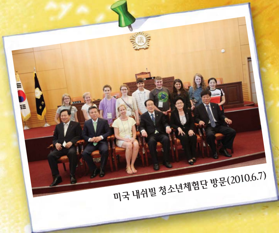
미국 내쉬빌 청소년체험단 방문(2010.6.7)