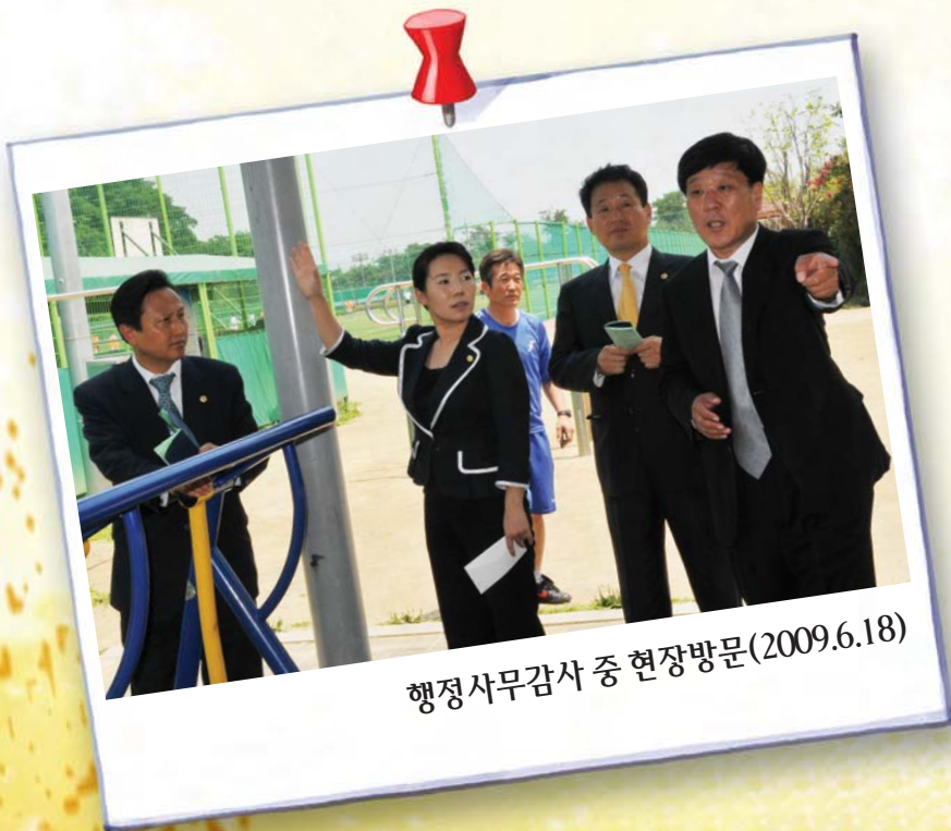
행정사무감사 중 현장방문(2009.6.18)