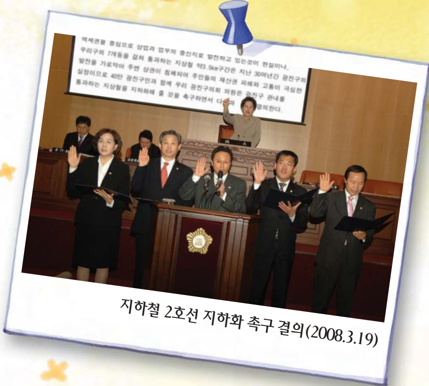
지하철 2호선 지하화 촉구 결의(2008.3.19)