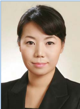
박성연 의원 광진구 나 선거구 (능동, 구의2동, 광장동, 군자동)