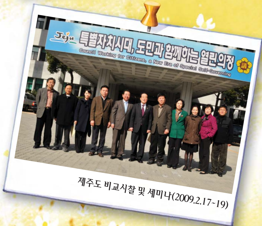
제주도 비교시찰 및 세미나(2009.2.17~19)