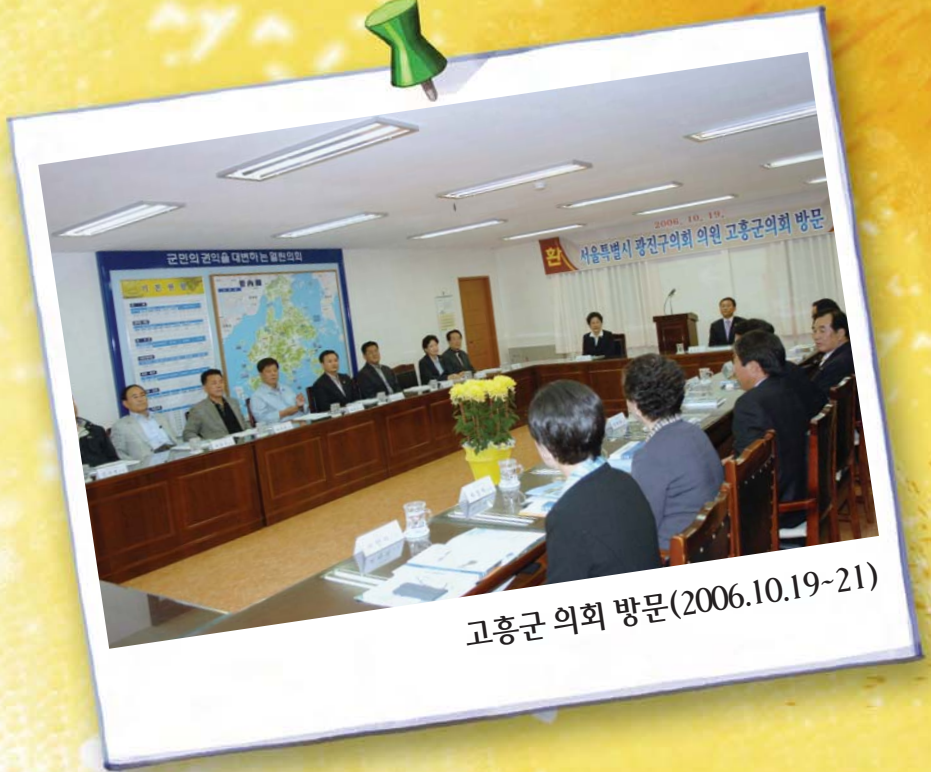
고흥군 의회 방문(2006.10.19~21)