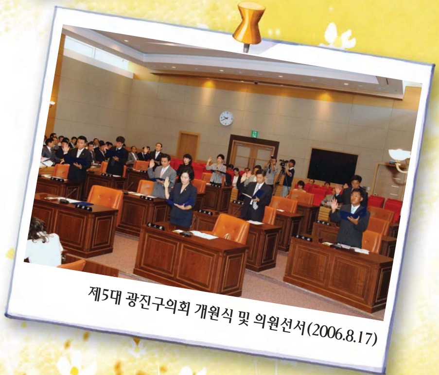
제5대 광진구의회 개원식 및 의원선서(2006.8.17)