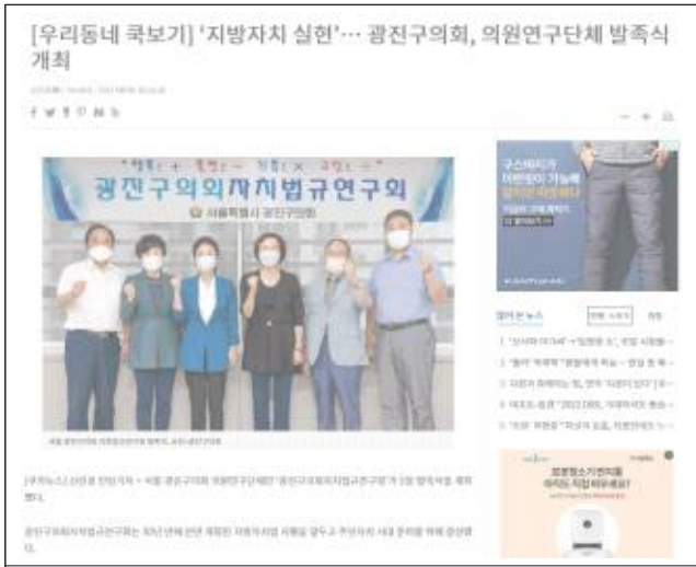
2021. 8. 6. <쿠키뉴스>