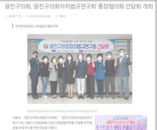
2021. 9. 30. <신아일보>