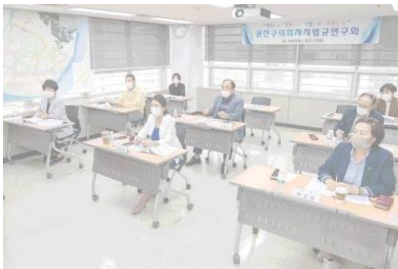
▲ 입법정책개발 연구용역 중간보고회를 개최한 '광진구의의회자치법규연구회'