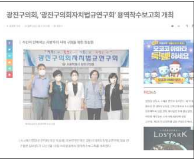
2021. 8. 12. <시사매거진>