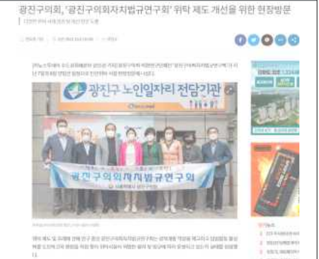
2021. 10. 13. <이뉴스투데이>