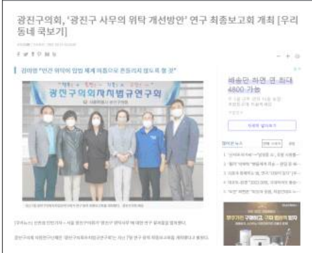
2021. 10. 12. <쿠키뉴스>